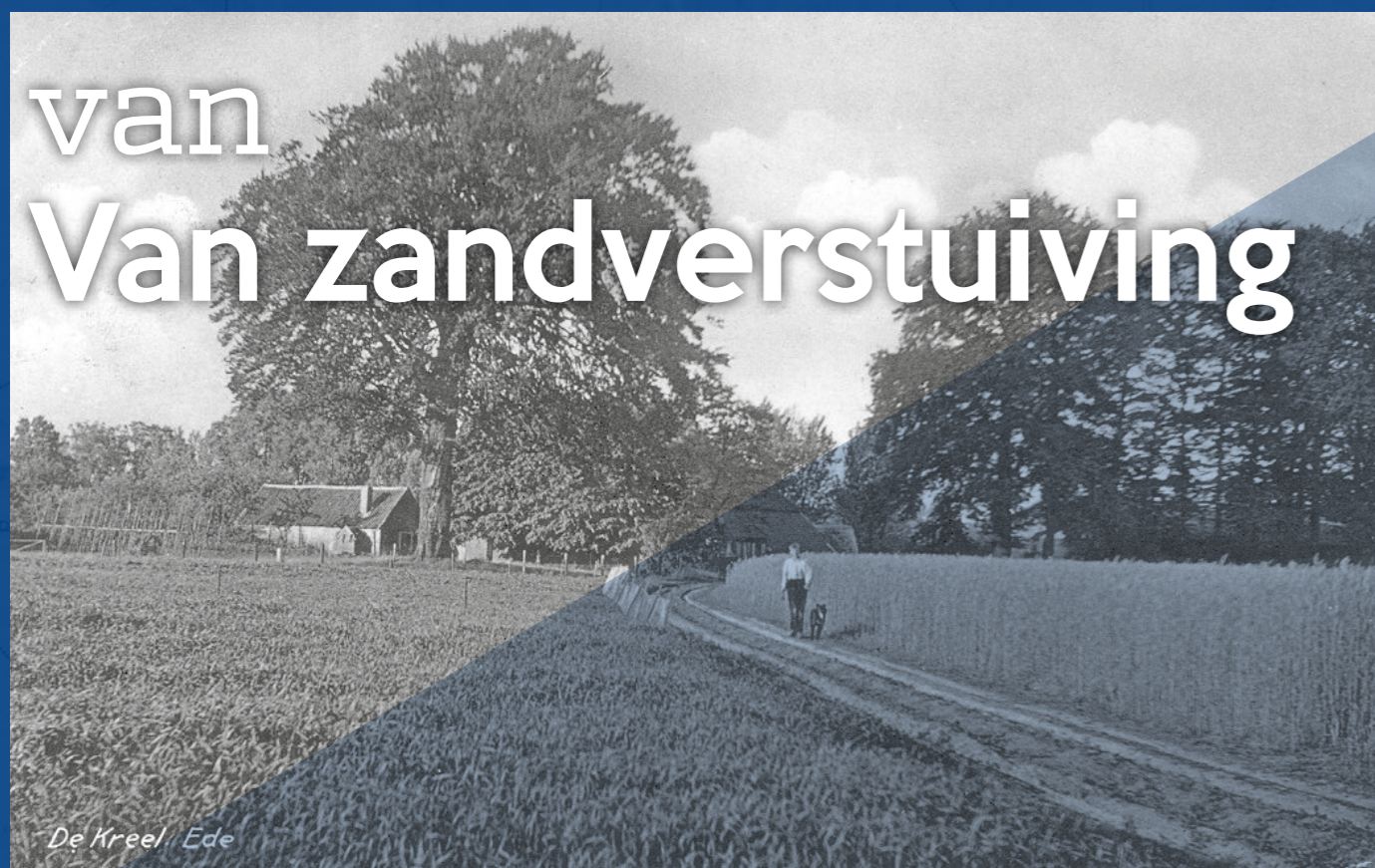
De Kreeel, Ede

Wanneer de 'Kreelseplas' is ontstaan, is onbekend, vermoedelijk is het ontstaan door veenaftgravingen. De plas ligt aan de Kreelseweg, vernoemd naar het goed 'Kreel'. Deze weg verbindt Ede, via Mossel, met Otterlo. Vanaf 1770 rukten zandverstuivingen ook hier sterk op: in 1840 was het 'Kreelse Zand' 130 ha groot. Later nam begroeiing in de vorm van heide en bossen weer toe. Sinds eeuwen ligt er op de Ginkel, grofweg noordelijk van de Herberg Zuid Ginkel, een landbouwenclave met akkers en weilanden. Deze landgoederen/boerennederzettingen kennen we onder de namen 'Kreel', 'Hindekamp' en 'Groot-Ginkel'. De Kreelseplas ligt op het laagstgelegen stuk van de Ginkel. In de nabijheid vinden we nog de 'Heidebloemplas' en de 'Plas van Gent'. Vanaf de Kreelseplas stroomde vroeger een beekje genaamd de 'Hartense Beek' zuidwaarts tot in de Ginkelse Heide, waar het 'verdween' naar het diepere grondwater. Verderop komt het water weer tevoorschijn, waar het mede de Renkumse beken voedt.